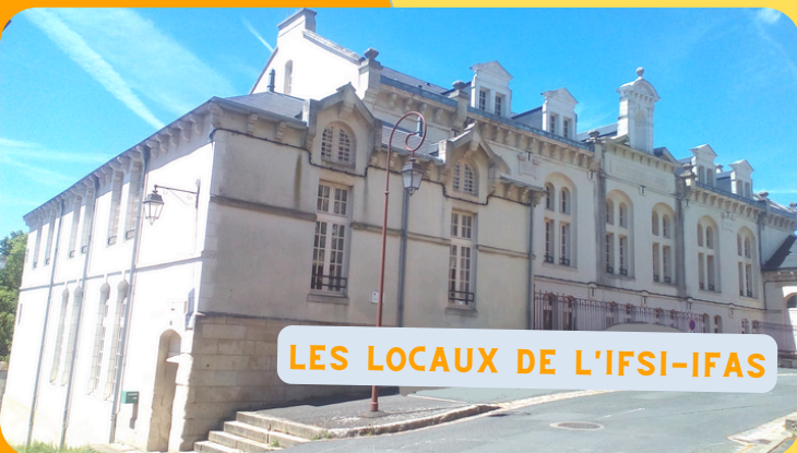
LES LOCAUX DE L'IFSI-IFAS